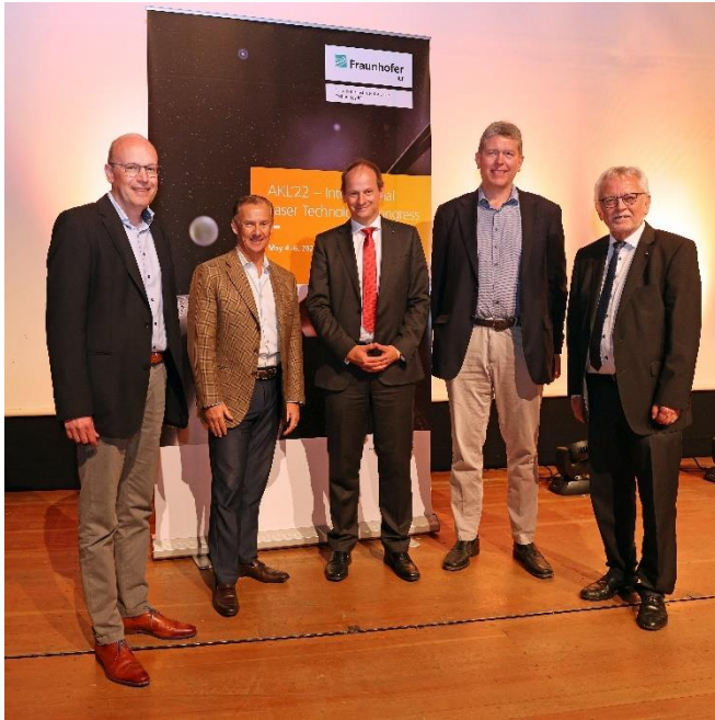
Bild 3: Treffen auf dem AKL'22 – International Laser Technology Congress in Aachen zur anschließenden Einweihung des UV Center of Excellence: